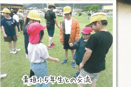
青垣小5年生との交流