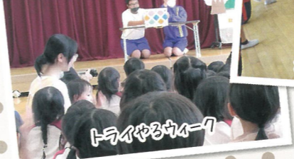
氷上西高生との交流