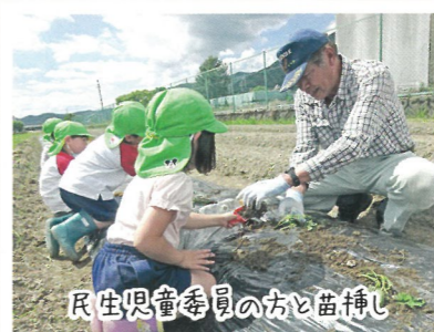
民生児童委員の方と苗植え