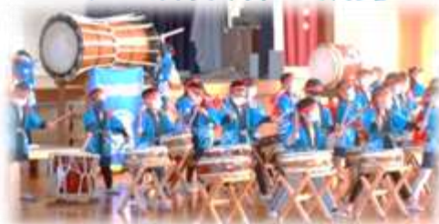
楽しいうれしい クリスマス会