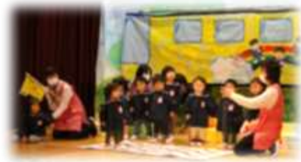
のりものだいすき (1歳児)