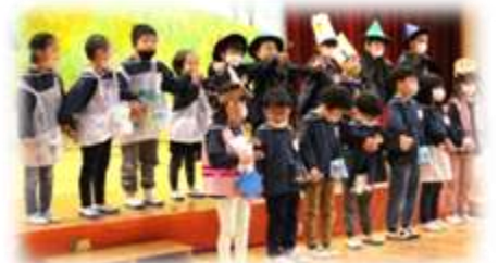
フィオーラとふこうのまじよ (5歳児・そら2組)