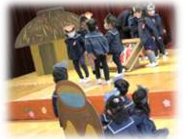
さるかにがっせん (3歳児)