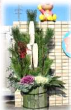
地域の方から門松をいただきました