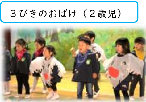
3びきのおばけ (2歳児)